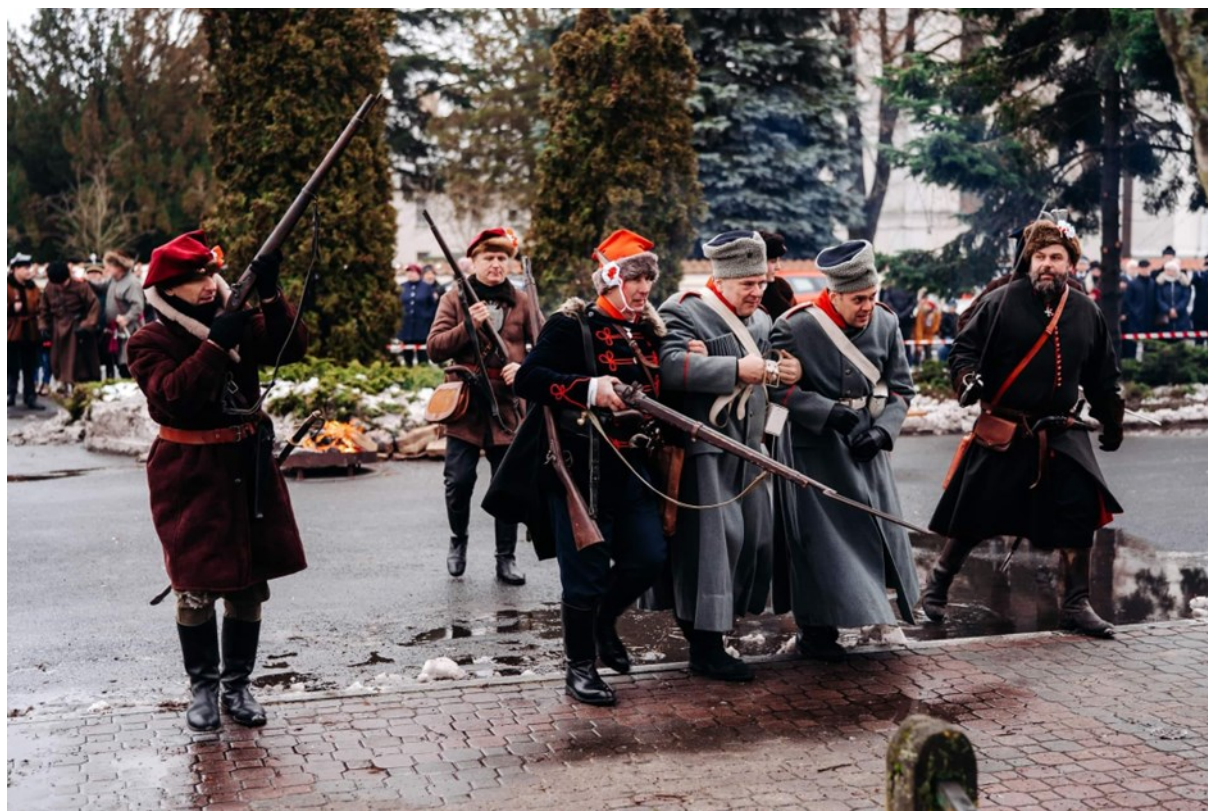
Inscenizacja Bitwy o Kodeń